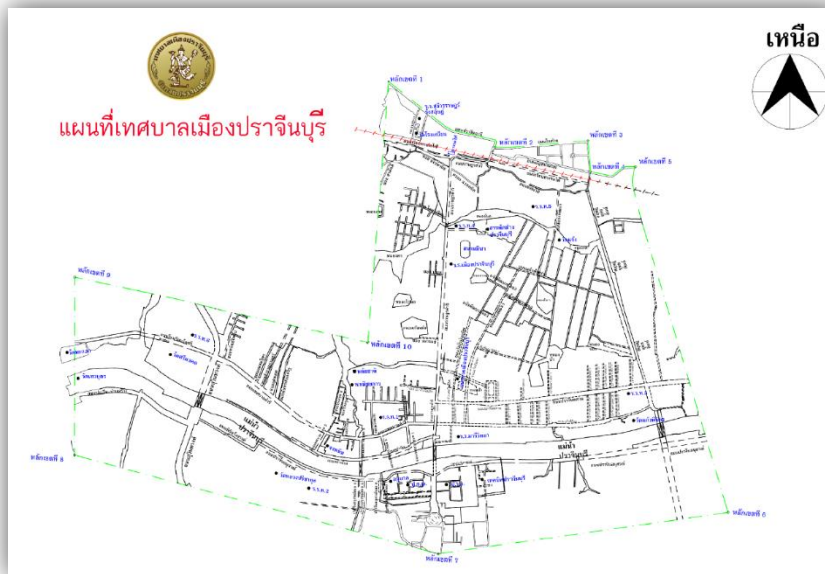
แผนที่เทศบาลเมืองปราจีนบุรี อำเภอเมืองปราจีนบุรีจังหวัดปราจีนบุรี