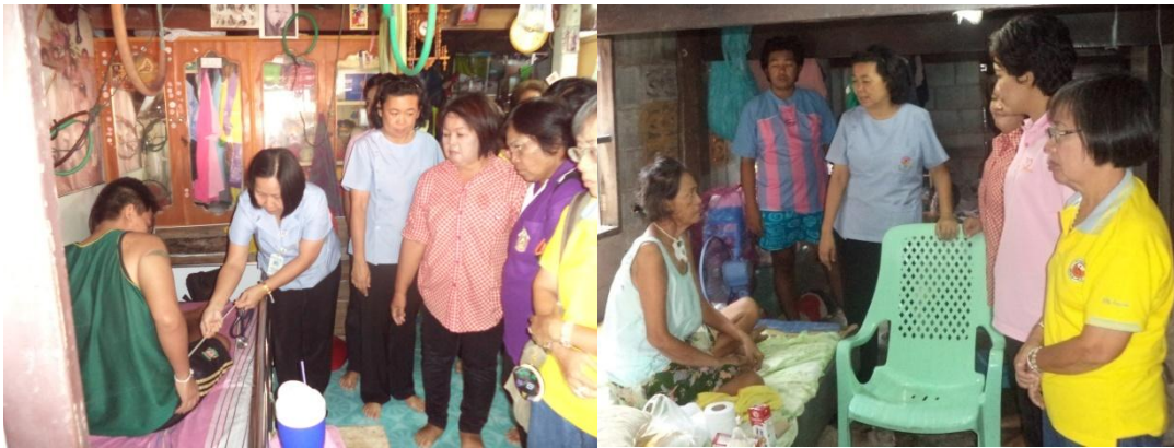
กองสาธารณสุขและสิ่งแวดล้อม ร่วมกับ อสม.และจิตอาสา ออก เยี่ยม และติดตาม ผลการรักษา ผู้พิการ ที่อยู่ใน ชุมชนเขตเทศบาลเมือง ปราจีนบุรี เมื่อวันที่ 3 กันยายน 2556