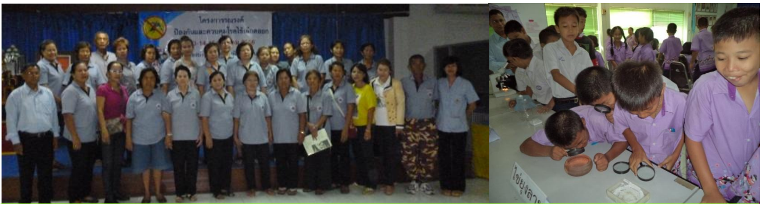
กองสาธารณสุขและสิ่งแวดล้อม โดย งานป้องกันและควบคุมโรคติดต่อ จัดอบรม โครงการรณรงค์ป้องกันและ ควบคุมโรคไข้เลือดออก ให้ความรู้กับ นักเรียนในสังกัดเทศบาล และอาสาสมัครสาธารณสุข เมื่อวันที่ 13 - 15 สิงหาคม 2556 ณ ห้องประชุมเทศบาลฯ ชั้น 3