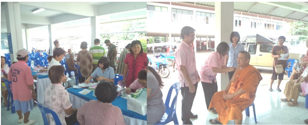
งานป้องกันและควบคุม โรคติดต่อ กองสาธารณสุขฯ ดำเนินการตรวจ คัดกรองและฉีด วัคซีนป้องกันไข้หวัดใหญ่ตาม ฤดูกาลแก่กลุ่มเสี่ยงโรคเรื้อรัง ระหว่างวันที่ 15-17 ก.ค.56 ณ อาคารชั้นล่าง สนง.เทศบาล เมืองปราจีนบุรี