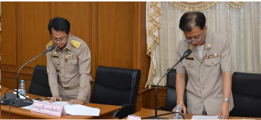
การประชุมสภาเทศบาลเมืองปราจีนบุรี วิสามัญ สมัยที่ 1 ครั้งที่ 1 เมื่อวันที่ 15 พ.ค.56 ณ ห้องประชุมสภาเทศบาลเมืองปราจีนบุรี